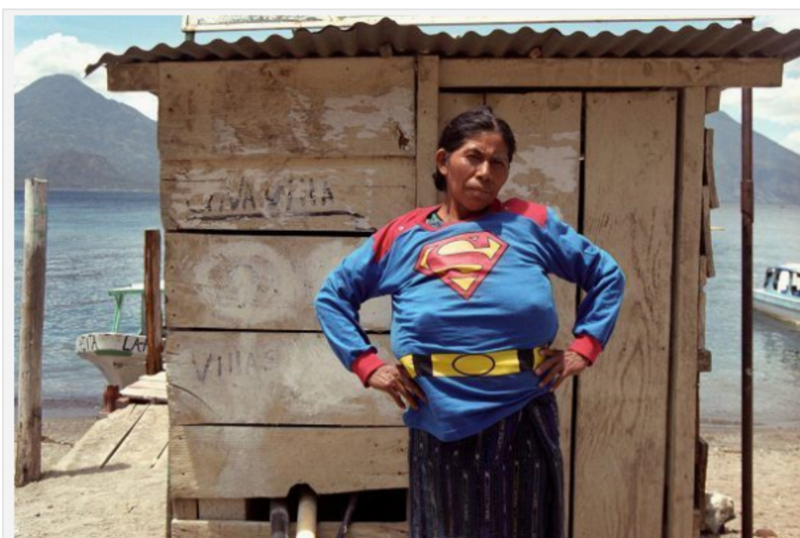
Walterio Iraheta, Súper chica en Atitlán, 2003, fotografía a color.