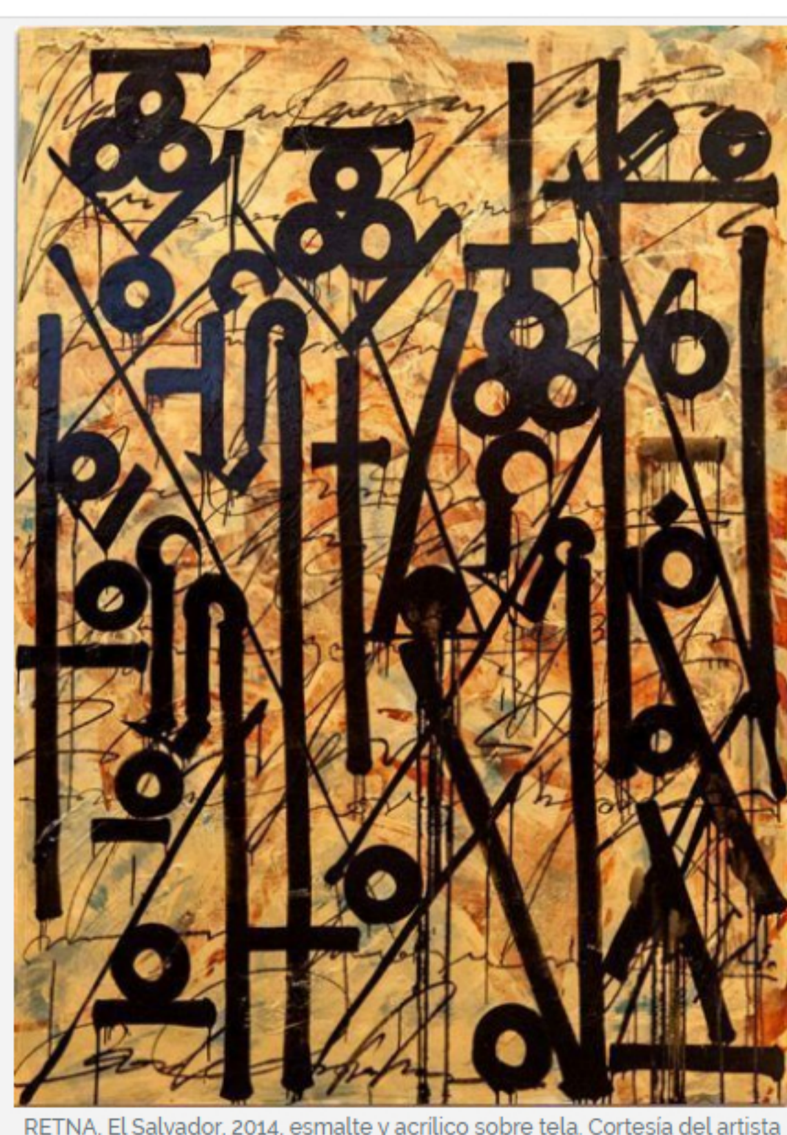
RETNA, El Salvador , 2014, esmalte y acrílico sobre tela.